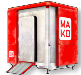
version mobilier de piste